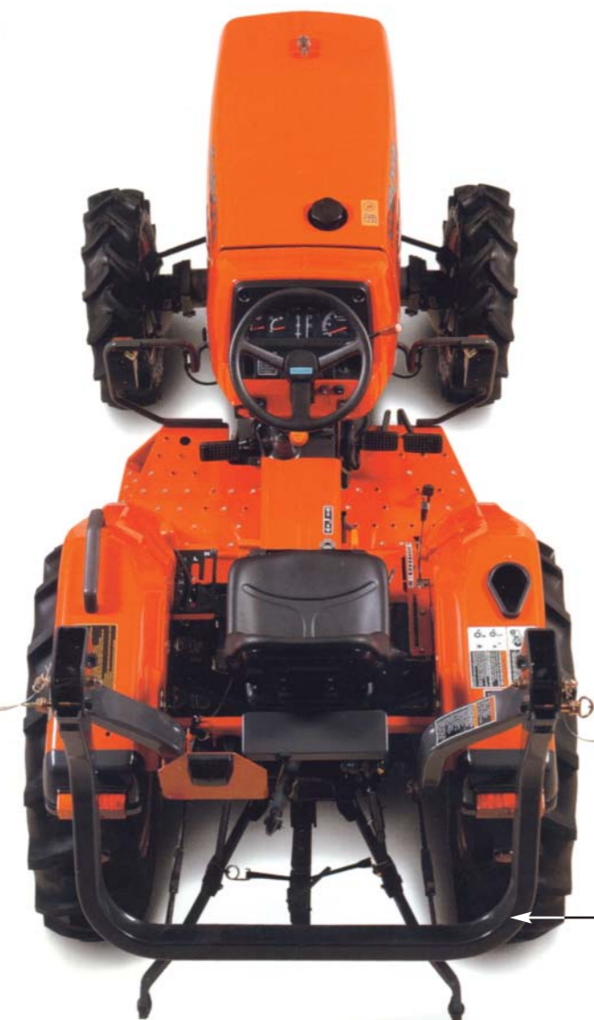
Sklopný ochranný rám při převrácení (ROPS)