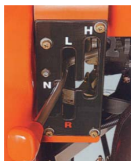
Skupinová řadicí páka