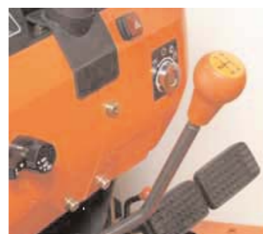
Hlavní řadicí páka (L3200)

Díky vysokému výkonu motoru a dobře konstruované převodovce provedete i obtížné úkoly snadno a rychle. Převodovka nabízí mechanické reversní ústrojí pro jízdu vpřed i vzad a je určena zejména pro práce s čelním nakladačem. Celkem je k dispozici 8 řadicích stupňů při jízdě vpřed a 4 stupně pro jízdu vzad – vhodný převod pro splnění jakékoliv pracovní činnosti.